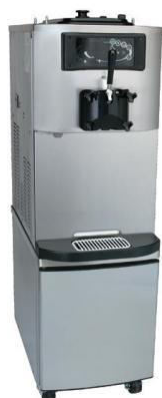
Abb. Mit optionalen Unterschrank auf Rollen mit Vordertüre