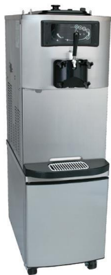
Abb. Mit optionalen Unterschrank auf Rollen mit Vordertüre